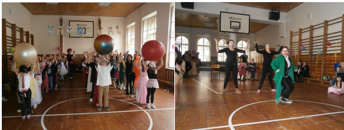
Foto 5 a 6: Děti ze školní družiny na Karnevalu a jejich starší spolužáci při tanečním vystoupení

V březnu jsme se připravovali na tradiční maškarní rej, děti vyráběly masky z papíru. Zároveň jsme určovali volně žijící a domácí živočichy i zvířata chovaná v zajetí. Četli jsme příběhy se zvířecí tematikou. Na konci měsíce jsme přivítali jaro, pozorovali jsme změny v přírodě a zaseli jsme nejrůznější druhy semen.