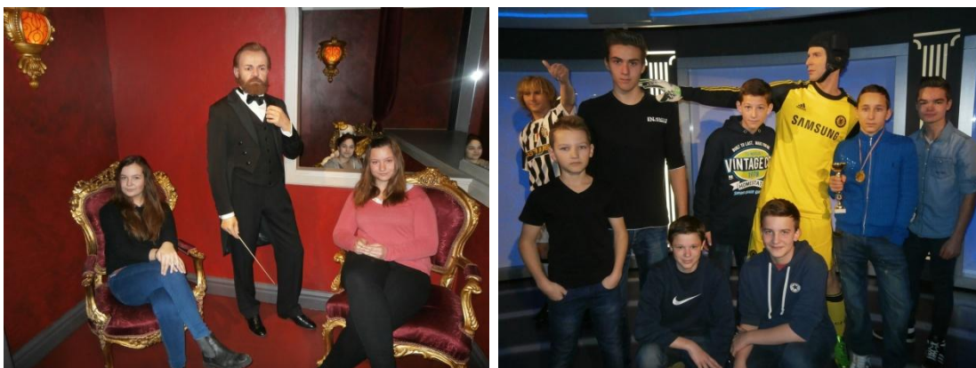
Foto 24 a 25: Žáci 8. třídy s významnými osobnostmi v Muzeu Grévin