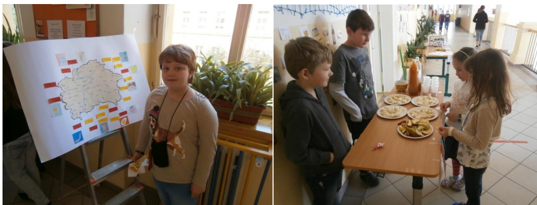
Foto 3 a 4: Čtvrtý projektový den ukázal vše, co si žáci pečlivě připravili.

Projektová forma vyučování je důležitou součástí výchovně vzdělávacího procesu, kdy dochází k rozšiřování poznatků získaných během vyučování. Žáci si tak intenzivně osvojují klíčové kompetence, převážně kompetence komunikativní, k řešení problémů, kompetence k učení, pracovní kompetence a v neposlední řadě kompetence sociální a personální.