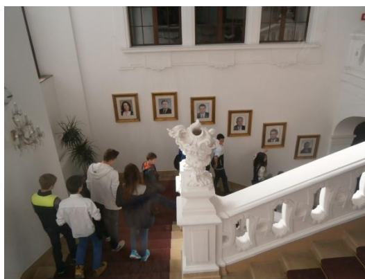
Foto 22 a 23: Žáci 8. třídy na prohlídce Poslanecké sněmovny a v jejich lavicích

Sedmá třída se u příležitosti oslav konce druhé světové války vydala na historickou exkurzi Prahou.